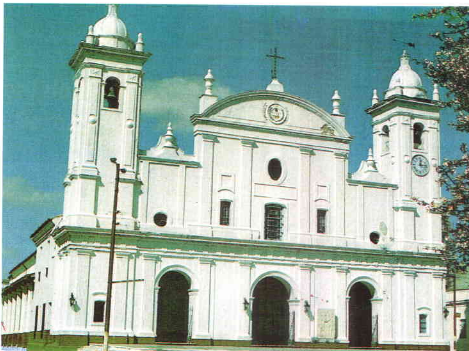
Catedral metropolitana de Asunción.

- ¿Mantienen relaciones con organizaciones municipalistas y Administraciones Locales europeas?