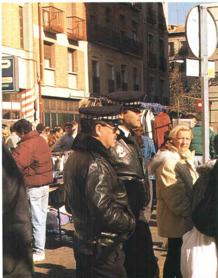
La FEMP seguirá realizando, a través de Convenios con el Ministerio de Justicia e Interior, cursos de especialización para mandos de los Cuerpos de Policía Local.

seguridad y convivencia, así como ser receptores de las quejas, denuncias y sugerencias de los vecinos en relación a los servicios municipales. La Policía de Barrio, aparte de promover la convivencia y solidaridad entre los vecinos, deben ser una parte de la política de prevención de la marginación y la delincuencia que desarrollan los Ayuntamientos en programas concretos de bienestar social.