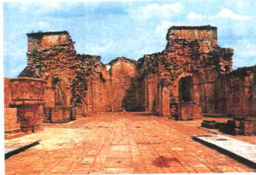
A la izquierda el Palacio del Gobierno; a la derecha, las ruinas de la misión de los Jesuitas.

das, dictado de ordenanzas, reglamentos y resoluciones, acceso al crédito privado y al crédito público (nacional e internacional), reglamentación y fiscalización del tránsito, del transporte público y de otras materias relativas a la circulación de vehículos. La cuestión actual es definir con precisión cuál es el alcance de todas estas atribuciones.