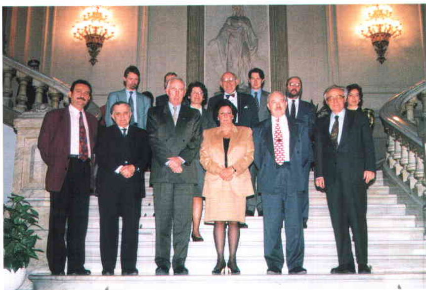
Los miembros del Comité, al término de la reunión, en el Ayuntamiento de Valencia.

Europea de Autonomía Local, cuyos preceptos básicos deberían quedar recogidos en el texto revisado del Tratado. En cuanto al principio de subsidiariedad, las modificaciones propuestas por el CMRE darían al artículo 3B la redacción siguiente: "La Comunidad, conforme al principio de subsidiariedad, sólo interviene en la medida en que los objetivos de la acción emprendida no puedan ser realizados suficientemente por los Estados miembros y las Entidades Locales y Regionales según sus competencias en virtud del derecho interno de los Estados miembros".