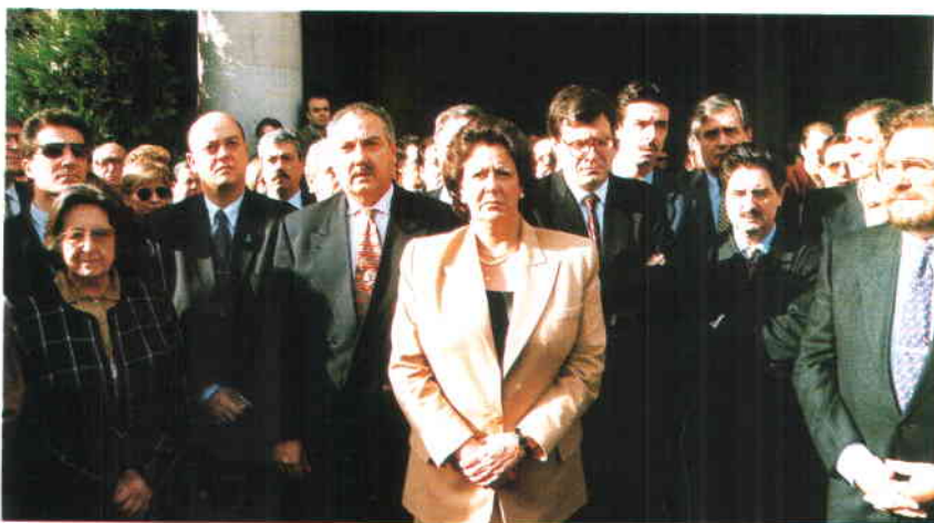
Los miembros de la Comisión Ejecutiva de la FEMP guardan cinco minutos de silencio durante su última reunión, el pasado día 18, en Valencia.

En su reunión de Valencia, la Comisión Ejecutiva de la FEMP adoptó el siguiente acuerdo institucional: