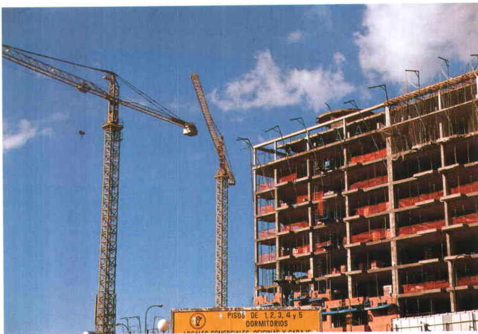
La Administración Central prevé la financiación de 500.000 viviendas en el cuatrienio 1996-1999 con una inversión de 370.000 millones de pesetas.

Las actuaciones para los próximos cuatro años se realizarán en un marco normativo que incluye modificaciones sobre el que regulaba el Plan 1992-1995 y que quedará plasmado en breve en un Real Decreto, tras cuya publicación en el Boletín Oficial del Estado, permitirá la firma de los convenios mencionados en el transcurso de una nueva Conferencia Sectorial. Entre otros puntos, para los próximos cuatro años se perfeccionará y modificará el conjunto de medidas destinadas a fomentar la urbanización de suelo, con destino preferente a viviendas de protección oficial (VPO), que tenga condiciones adecuadas de precio de venta. Para ello se han mejorado algunos aspectos técnicos de la actual línea de apoyo financiero y se ha creado una nueva línea de financia-